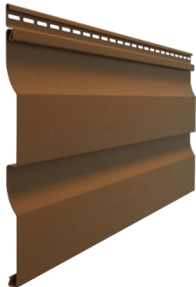
Сайдинг D4,5D (корабельный брус, 4,5")