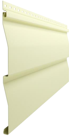
Сайдинг D4,5D (корабельный брус, 4,5")